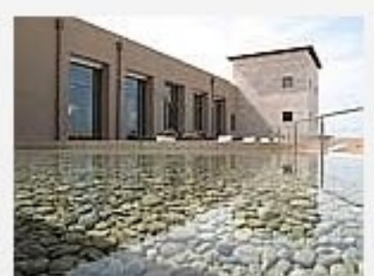
COSTA NAVARINO Rating: ★★★★★ Rating 3.7