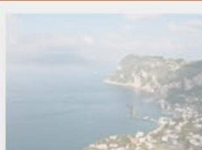
BLU CAPRI RELAIS Rating: ★★★★★ Rating 2.5