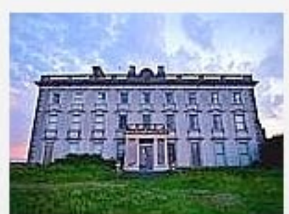
Rating: ★★★★★ Rating 3.3