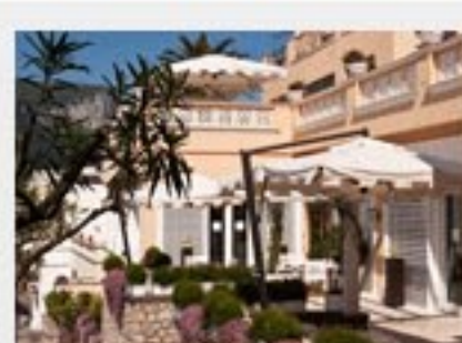
CAPRI TIBERIO PALACE Rating: ★★★★★ Rating 3.5