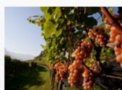
CANTINA TRAMIN, IL TERRITORIO E I VINI Rating: ★★★★★ Rating 5.0