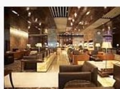
Rating: ★★★★★ Rating 0.0