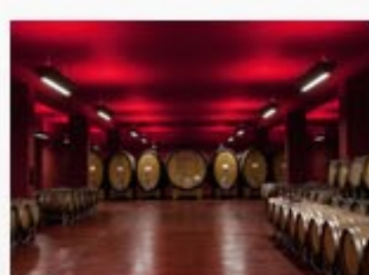
CANTINE E DESIGN Rating: ★★★★★ Rating 3.0