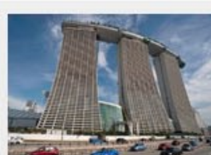
IL MARINA BAY SANDS SINGAPORE Rating: ★★★★★ Rating 4.7